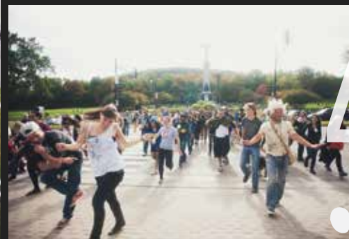
La fórmula secreta: ¿De qué se trata?